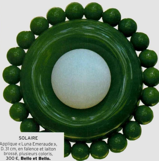
SOLAIRE Applique « Luna Emeraude », D. 31 cm, en faïence et laiton brossé, plusieurs coloris, 300 €, Bello et Bello.