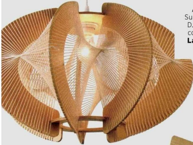
ARACHNÉENNE Suspension « Sepia », D. 54 cm, en MDF et coton blanc, 269 €, Laurie chez Keria.