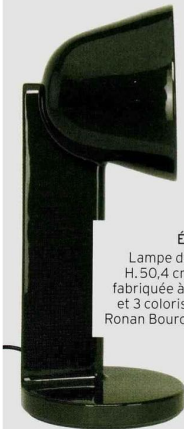
ÉPURÉE Lampe de table « Side », H. 50,4 cm, en céramique fabriquée à la main, 3 formes et 3 coloris au choix, design Ronan Bouroullec, 870 €, Fios.