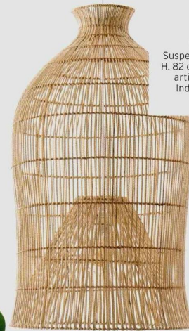
ETHNIQUE Suspension « Pengadi », H. 82 cm, en rotin tressé artisanalement en Indonésie, 299 €, AM.PM.