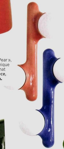
ORGANIQUE Applique « Prickly Pear », H. 40 cm, en céramique coulée et verre mat dépoli, 680 € pièce, Mickael Koska.

Revisités à travers le prisme du design, les matériaux naturels et savoir-faire traditionnels offrent des possibilités aussi variées qu'authentiques.