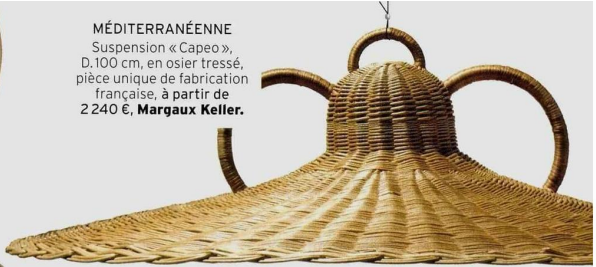
MÉDITERRANÉENNE Suspension « Capeo », D. 100 cm, en osier tressé, pièce unique de fabrication française, à partir de 2 240 €, Margaux Keller.