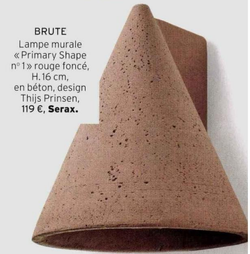
BRUTE Lampe murale « Primary Shape n° 1 » rouge foncé, H. 16 cm, en béton, design Thijs Prinsen, 119 €, Serax.