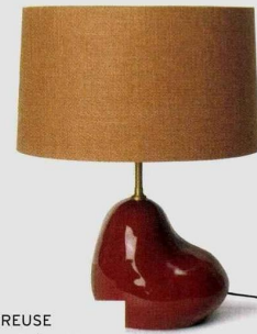
GÉNÉREUSE « Hebe », lampe à poser, H. 30 cm, en céramique, 4 coloris au choix, 159 € hors abat-jour, Ferm Living.